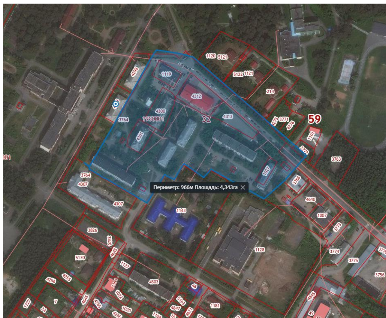
Схема для разработки проекта планировки и проекта межевания части территории с. Усть-Качка Усть-Качкинского сельского поселения Пермского муниципального района, включающей земельные участки под многоквартирными домами №№ 3,4,5,6,7,8 по ул. Новый поселок и № 3 по ул. Октябрьская